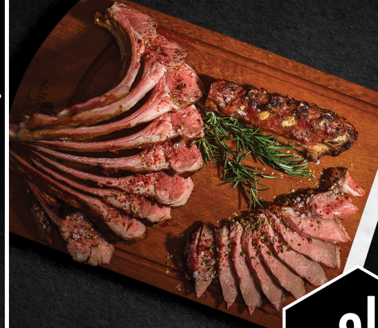
سلطان شيف سبيشال Sultanchef Special