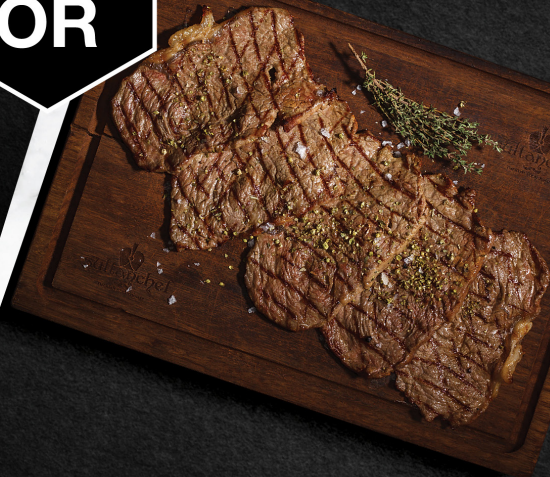
انتركوت ستيك Beef Entrecote