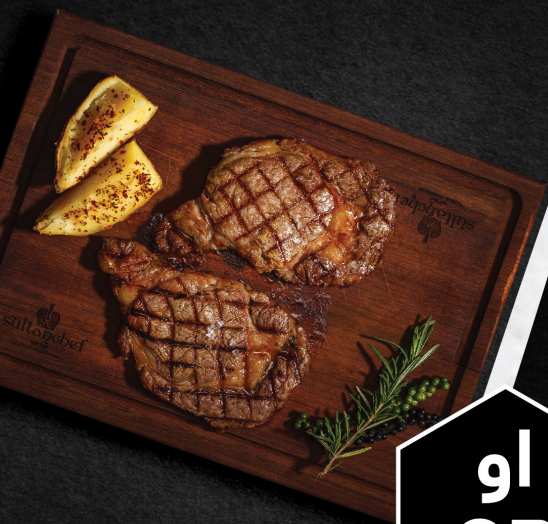
سلطان شيف كوبي بيف Sultanchef Kobe Beef